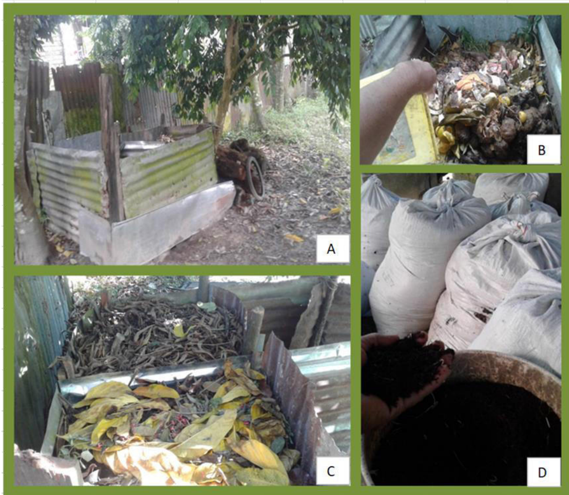
Figura 2. Proceso de elaboración de biofertilizante sólido (abono): A. Lugar apropiado con sombra y suelo seco, abonera hecha con calaminas y maderos reciclados B. Agregando desperdicios de la cocina C. Cajones o celdas de la abonera en proceso de llenado secuencial. D. Abono o producto obtenido luego de 4 meses.

Para la construcción de la abonera podemos usar calaminas usadas (Figura 2A), maderas o tallos de palmeras, caña brava, etc. Las ramas de los árboles y los arbustos deben ser delgadas (con un máximo de 1 cm de diámetro). Se colocarán los desperdicios (cáscaras de frutos, de huevos y otros sobrantes de alimentos), así como la biomasa vegetal (ramas, hojas). Podremos